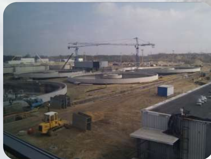
Foto: Budowa oczyszczalni ścieków Czajka w Warszawie

W latach tych wydatkowano w sumie ok. 46,3 mld zł, w tym 32,4 mld zł na sieć kanalizacyjną