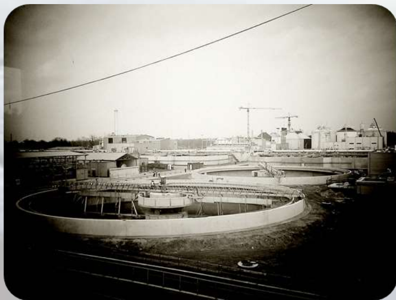
Foto: Oczyszczalnia ścieków Czajka w Warszawie

Cel: Ochrona środowiska wodnego przed niekorzystnymi skutkami zrzutów ścieków komunalnych